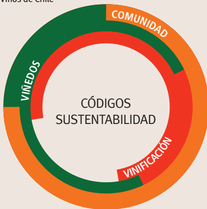
FIGURA 2. Esquema Código de Sustentabilidad Vinos de Chile