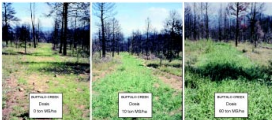
Figura 1. Resultados con distintas dosis de aplicación de lodo sobre suelo degradado en Búfalo Creek

nas experiencias de INIA y SAG en conjunto con Aguas Andinas.