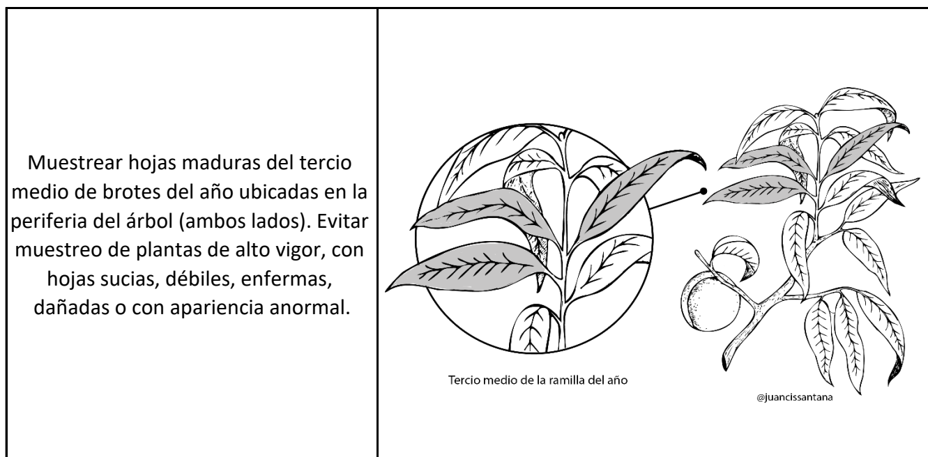
Figura 1: Protocolo de muestreo en duraznero y nectarino, hojas achuradas son las que se deben seleccionar.