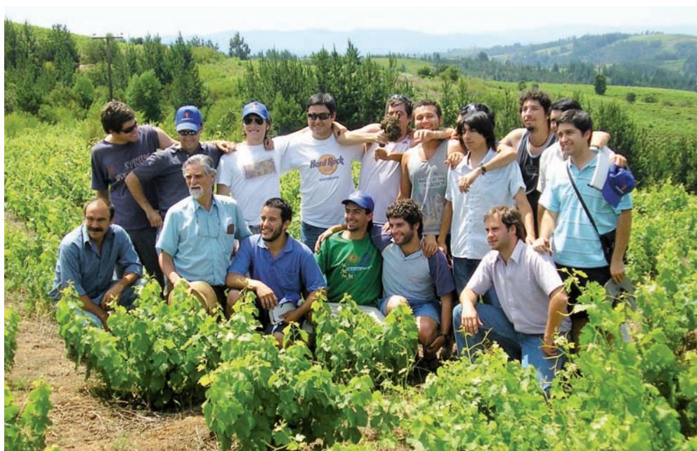
Grupo de alumnos en una visita a terreno.