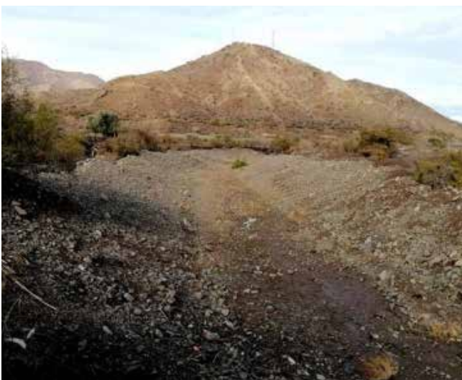
Figura 1. Río Colina, fotografía tomada en terreno, un día después de la primera lluvia del año 2020.

Estos proyectos e iniciativas que se desarrollan en la “Villa Peldehue”, están liderados en su mayoría por profesores de la Escuela de Medicina Veterinaria que, en conjunto con alumnos de distintas carreras, han desarrollado campañas de vacunación, tratamientos sanitarios y charlas educativas dirigidas a los pequeños productores que componen la Villa. Esto ha permitido que se genere un vínculo entre la comunidad y quienes están en terreno trabajando con los animales y la gente, lo cual acerca la realidad que viven estos pequeños productores agropecuarios.