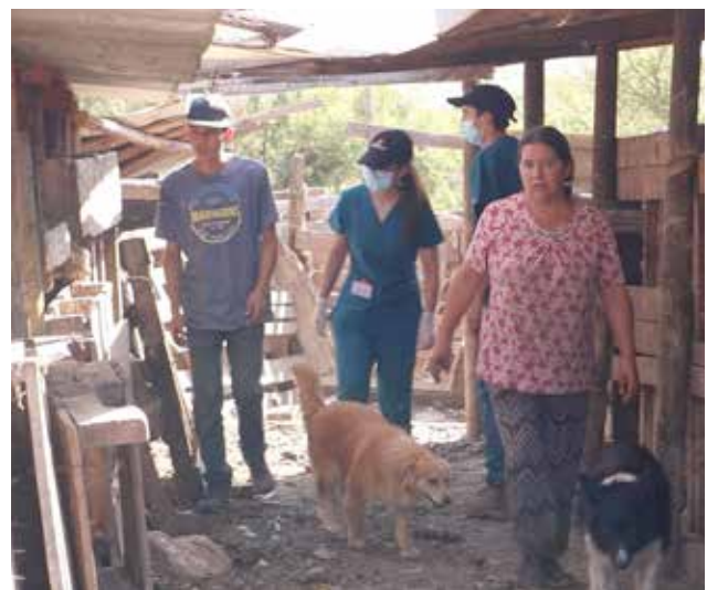
Operativo veterinario organizado por estudiantes de primer año de Medicina Veterinaria de la UC en Villa Peldehue.