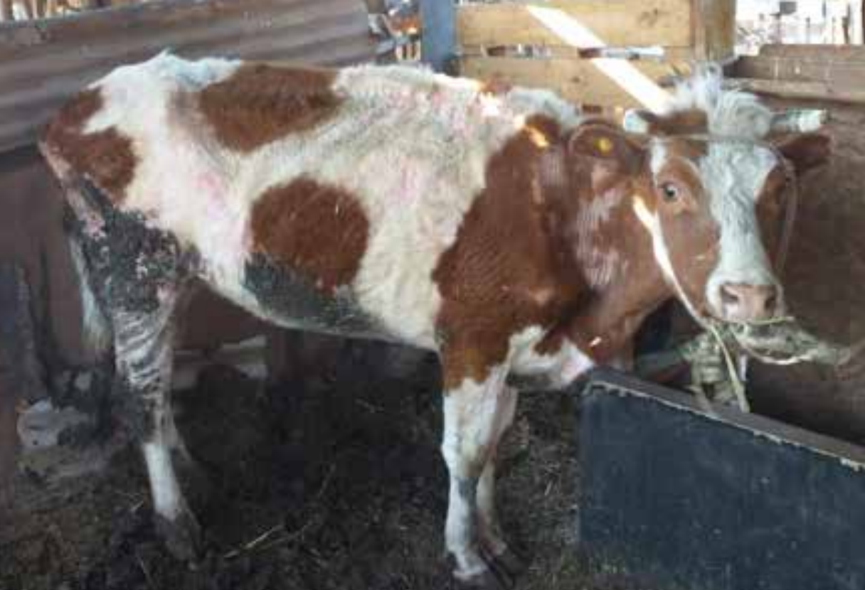
Figura 3. Ejemplar bovino con evidente grado de desnutrición y lesiones en piel producto de la fotosensibilización sin causa determinada reflejando la situación actual de muchos animales en la Villa Peldehue.

Poder generar mejoras, en un sistema productivo que se enfrenta a condiciones agroclimáticas desfavorables, es uno de los grandes desafíos que se presentan al trabajar en la Villa Peldehue, ya que, si bien los productores tienen la motivación y disposición a realizar mejoras, muchas de éstas se escapan de las manos por falta de recursos no solo naturales, sino también económicos.